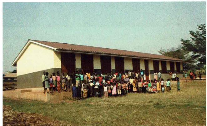
Von BeLu Ugandahilfe gebaute Schule in Kabongo